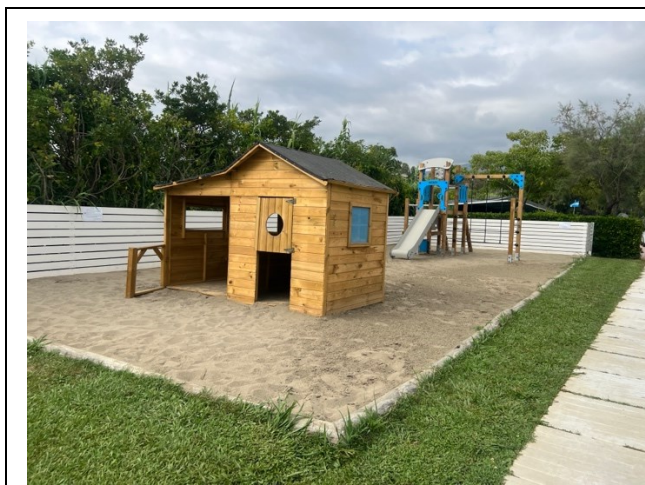
Area giochi per bambini